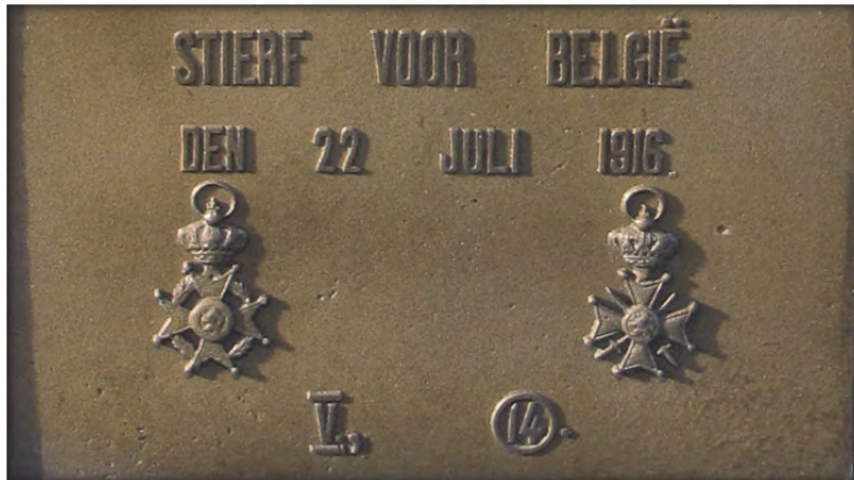
Links de Orde van Leopold II, rechts het Oorlogskruis. Onderaan de symbolen voor de Overwinningsmedaille en de Herinneringsmedaille.

Soms in een archaisch Nederlands ('granaatslinger(aar)') of met cryptische afkortingen: T.S.F., T.A.G., T.A.S.S. enz. 4 Onder op de bronzen plaat staan de eretekens. Meestal zijn dat het Kruis van Ridder in de Orde van Leopold II en het Oorlogskruis (met zwaarden). Het eerste is een nationale orde, het tweede een militaire onderscheiding. Aanvankelijk werd het Oorlogskruis uitgereikt voor een moedige daad tegenover de vijand; later ook voor vijf frontstrepen 5 of een individuele vermelding op het legerdagorder. Na verloop van tijd kreeg vrijwel elke oud-strijder, oud-krijgsgevangene of oud-geïnterneerde het. Tot ongenoegen van zij die het Oorlogskruis gekregen hadden voor een moedige daad.