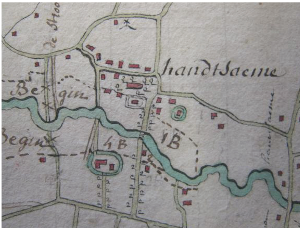
Detail uit Ommelooper der Wateringe gezeyd de Bet Oostersche Broucken (vermoedelijk 17 de eeuw). Uit: RIJKSARCHIEF BRUGGE, Fonds Jonckheere, nr. 1217. Croonevoorde is gesitueerd onder de aanduiding "4C" Agentschap R-O Vlaanderen - Onroerend Erfgoed - 2008 - p. 191

Regelmatig komen in oude geschriften adellijke geslachten voor die verwijzen naar Handzame. Die adellijke geslachten hadden op Handzame hun kastelen: Amersvelde, Croonevoorde, Watervliet. Wij zullen het hier voornamelijk hebben over het kasteel van Croonevoorde en zijn heren.