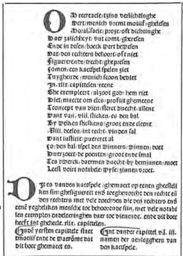
Bladzijde uit “Dat Kaetspel ghemoralizeert”